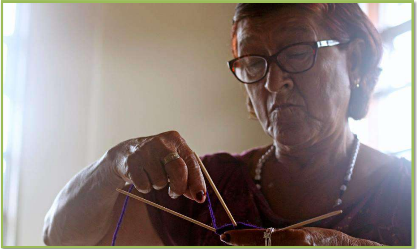
Fotografía: Mujer tejiendo. Grupo: Mujeres Semillas de Girasol.